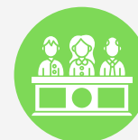
Comité de Contraloría Social